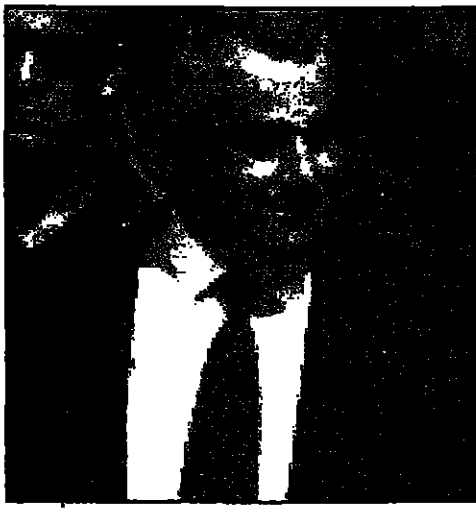
اسحق موشاي، مدير الخارجية الإسرائيلي